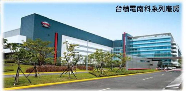
台積電南科系列廠房