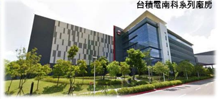
台積電南科系列廠房