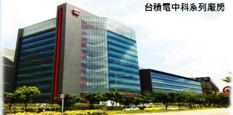
台積電中科系列廠房